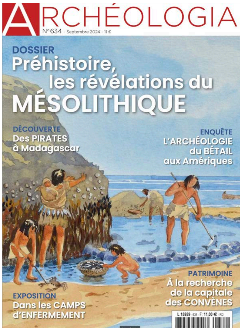
Fig. 4 – Couverture du magazine spécialisé Archéologia dont la rubrique « Patrimoine » porte sur les travaux du PCR.