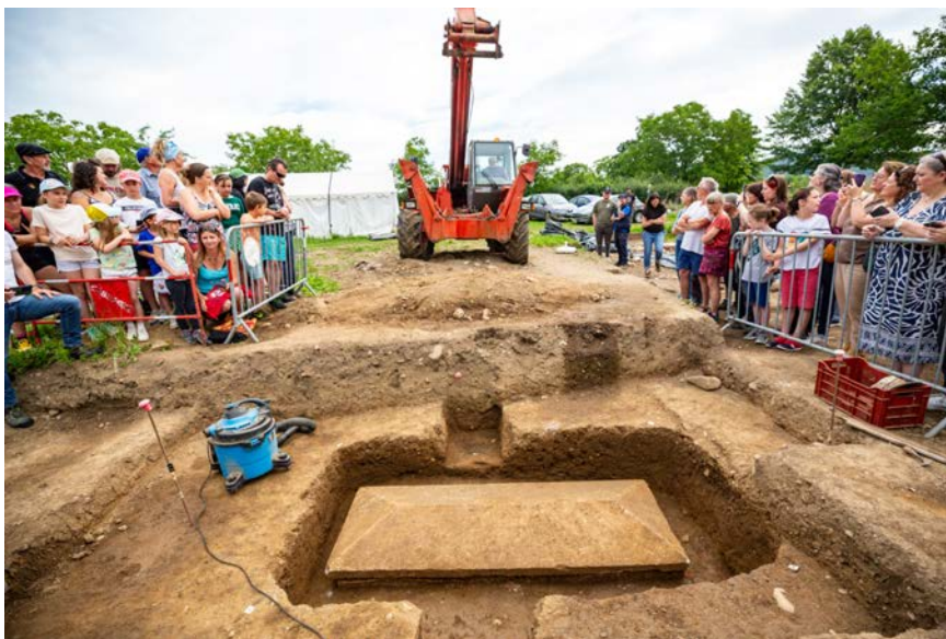
Fig. 11 – Ouverture en public du sarcophage.