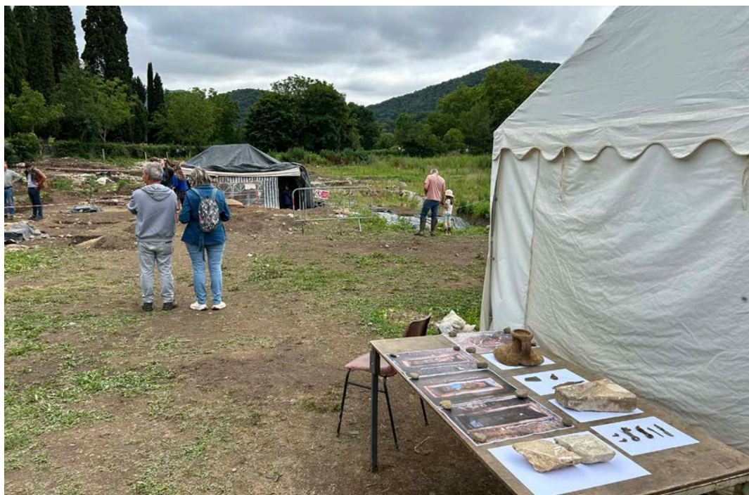
Fig. 13 – Photographie de l'exposition de mobilier lors de la grande visite du 13 juillet.