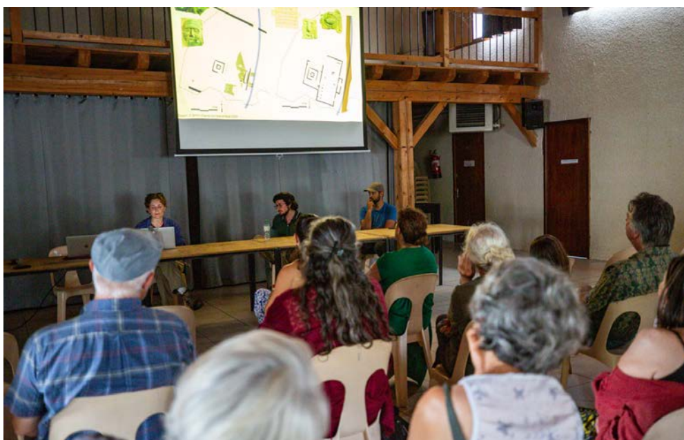
Fig. 17 – Première édition du rendez-vous jeunes chercheurs.