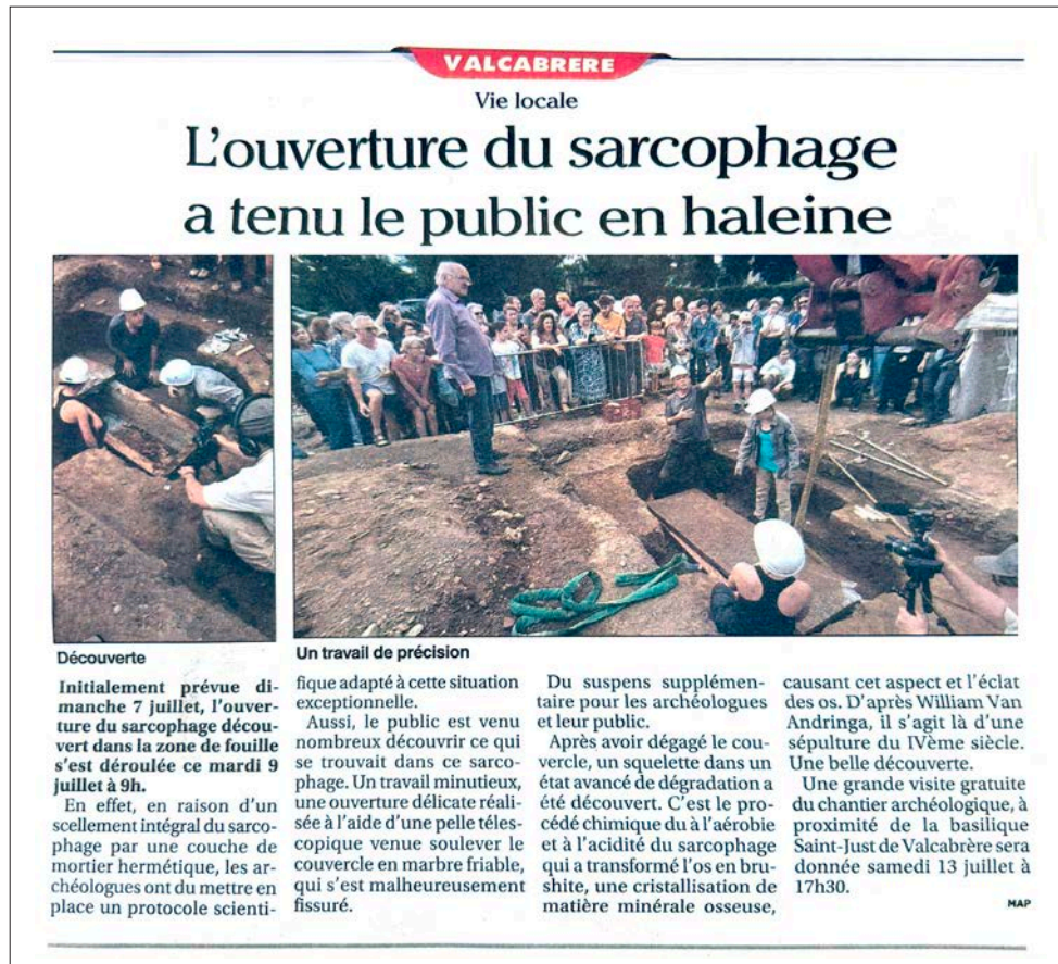
Fig. 15 – Article de presse paru dans le Petit journal Haute-Garonne.