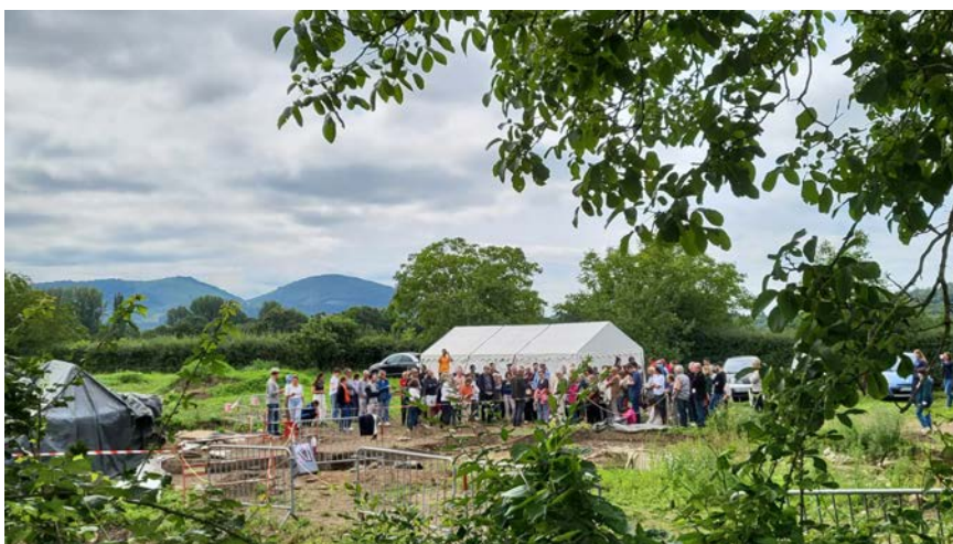
Fig. 12 – Photographie de la grande visite du 13 juillet.