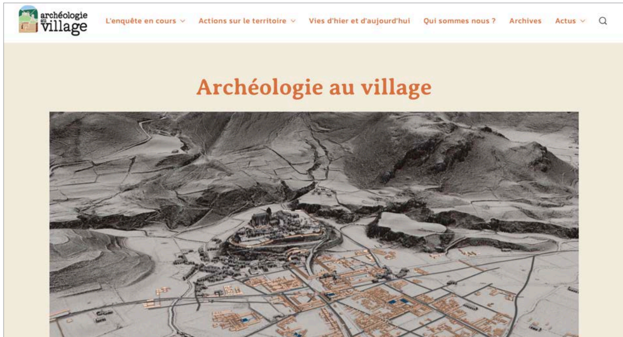
Fig. 3 – Page d'accueil du site internet archéologieauvillage.com (conception Julie Quéré).