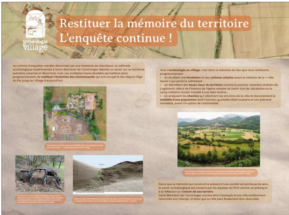
Fig. 29 – Exposition de panneaux Archéologie au village installée sur les grilles de l'école de Saint-Bertrand-de-Comminges (réalisation Julie Quéré).