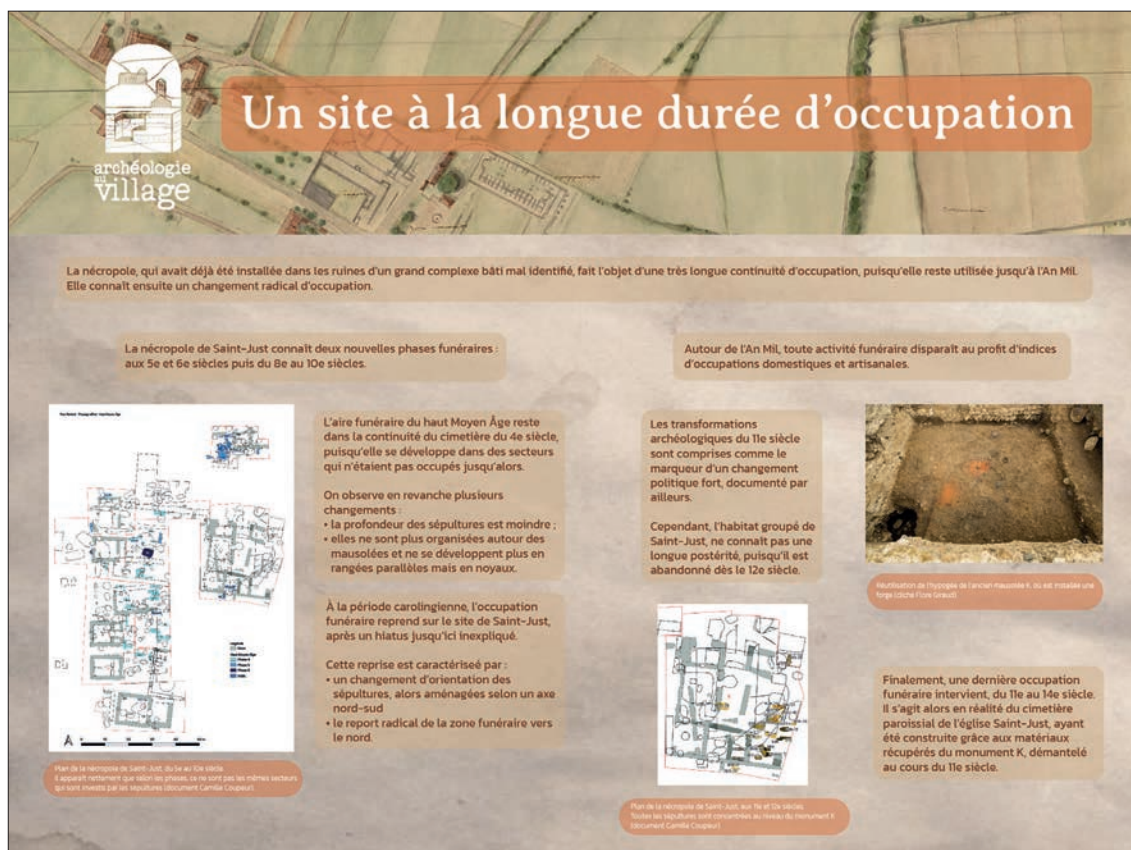
Fig. 32 – Panneau supplémentaire réalisé pour le site de Saint-Just (réalisation Julie Quéré)