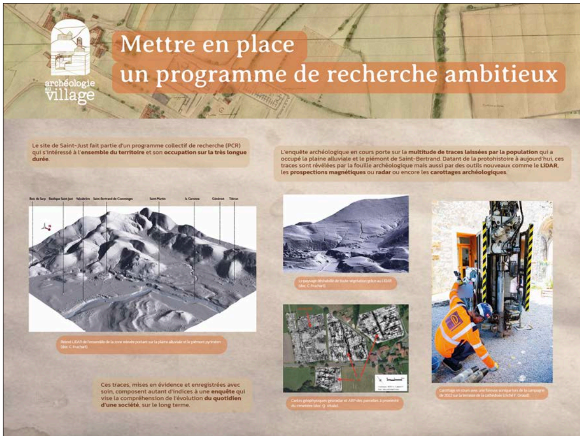
Fig. 22 – Exposition de panneaux Archéologie au village installée sur les grilles de l'école de Saint-Bertrand-de-Comminges (réalisation Julie Quéré).