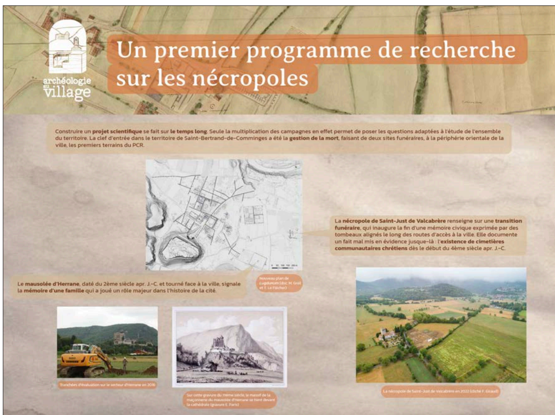
Fig. 23 – Exposition de panneaux Archéologie au village installée sur les grilles de l'école de Saint-Bertrand-de-Comminges (réalisation Julie Quéré).