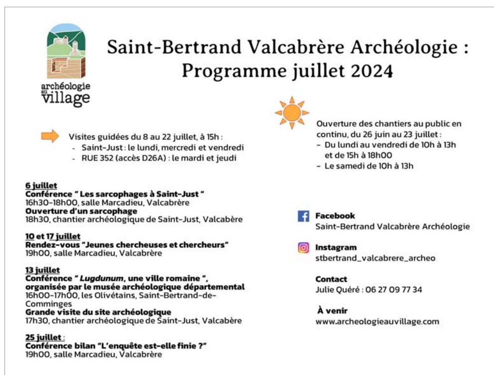
Fig. 9 – Programme de médiation de juillet 2024 (Clara Heurtault).

En parallèle de ces actions, dans la volonté de poursuivre l'effort événementiel et dans la lignée du succès des visites quotidiennes du camp militaire en 2022, il a également été décidé de proposer des visites approfondies et quotidiennes en juillet : les lundis, mercredis et vendredis sur le chantier de Saint-Just et les mardis et jeudis sur le chantier de la rue 352. Ces dernières n'ont néanmoins pas rencontré un grand succès, puisque le public n'a pas répondu présent à tous les rendez-vous, et que ce sont entre 2 et 9 personnes qui se sont présentées lorsque cela a été le cas. Cela peut être dû à manque d'efficacité ou de clarté de la communication à leur sujet (réseaux sociaux, presse, affichage commerces et relai par les Olivétains, office de tourisme départemental). On note que les rendez-vous gagneraient certainement à être plus ponctuels, de manière à souligner leur caractère exceptionnel.