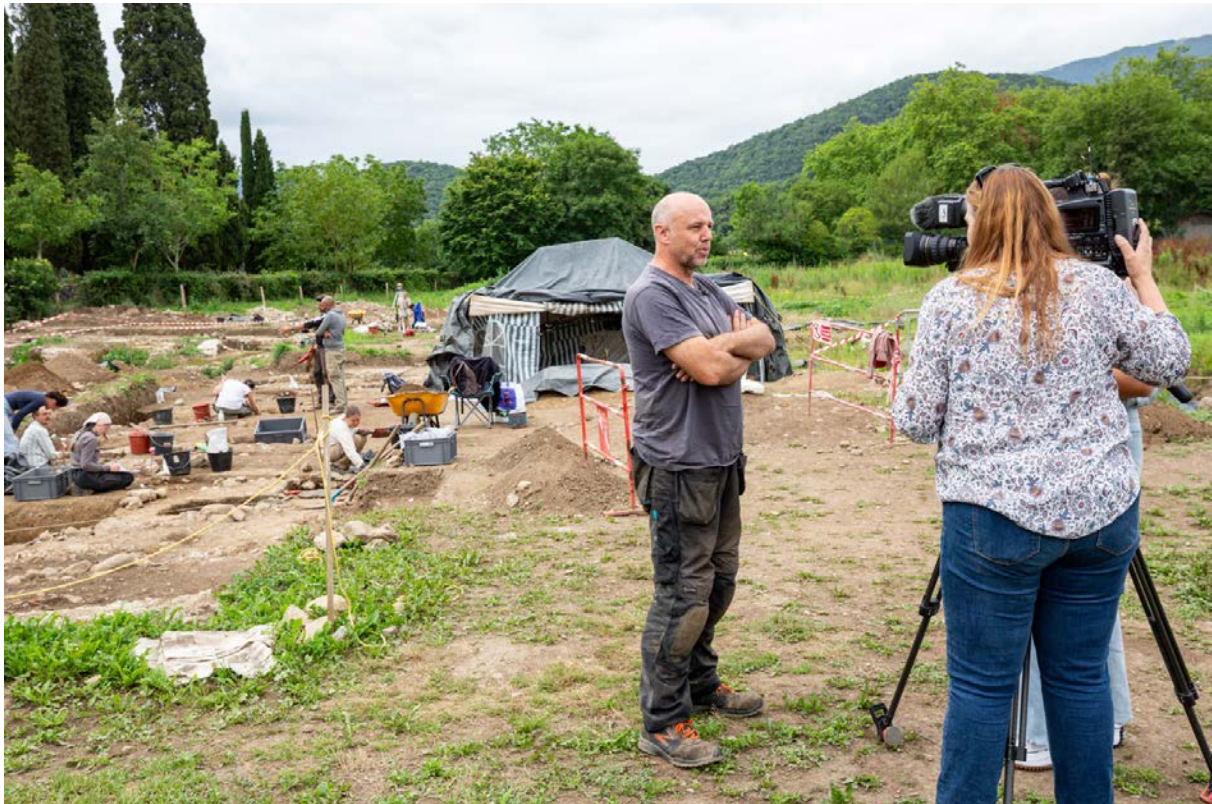
Fig. 16 – Captation en cours pour le reportage de France 3 Occitanie diffusé le 17 juillet à 12h.