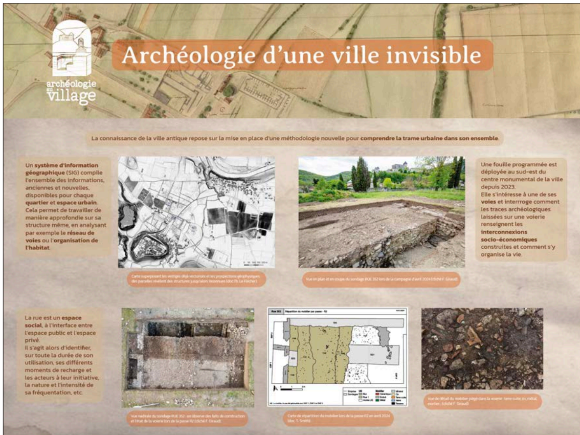
Fig. 28 – Exposition de panneaux Archéologie au village installée sur les grilles de l'école de Saint-Bertrand-de-Comminges (réalisation Julie Quéré).