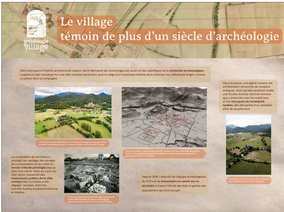
Fig. 21 – Exposition de panneaux Archéologie au village installée sur les grilles de l'école de Saint-Bertrand-de-Comminges (réalisation Julie Quéré).