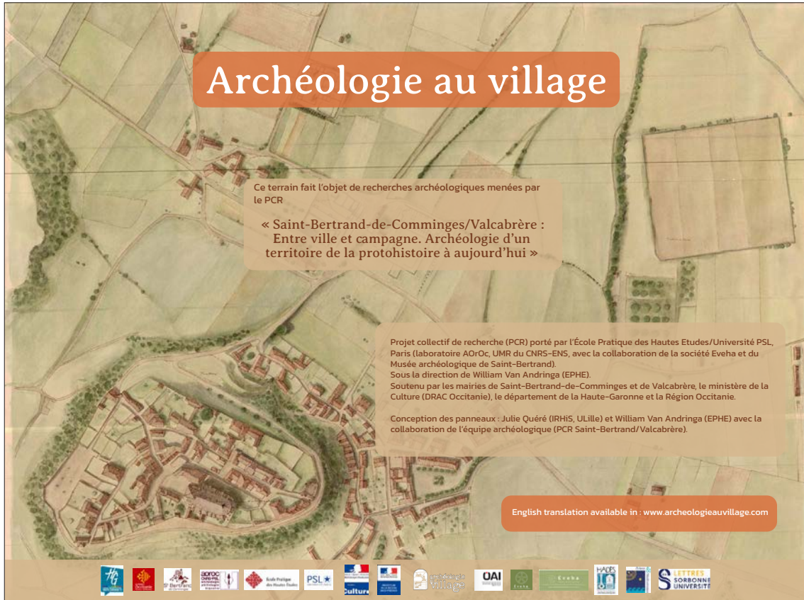
Fig. 20 – Exposition de panneaux Archéologie au village installée sur les grilles de l'école de Saint-Bertrand-de-Comminges (réalisation Julie Quéré).