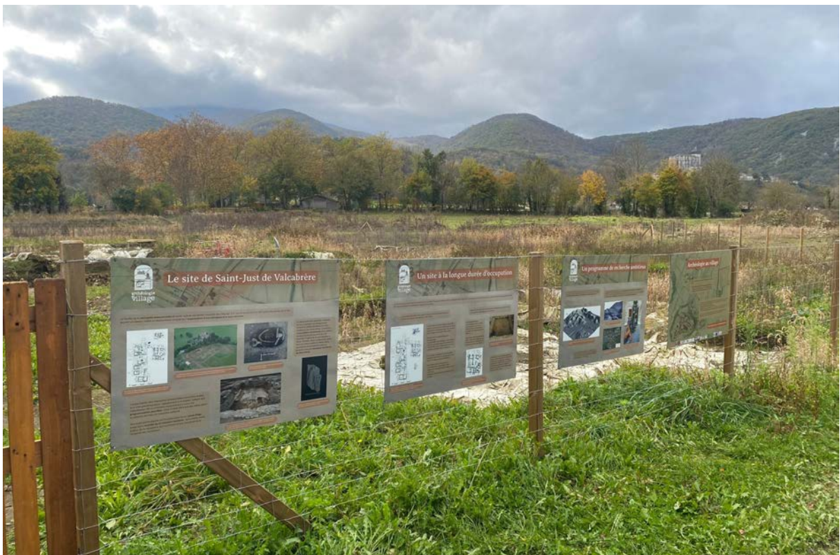
Fig. 2 – Vue d'ensemble de l'exposition de panneaux installée sur le site de Saint-Just à l'issue de la campagne.