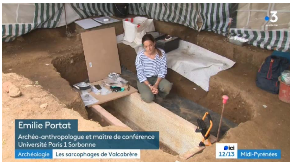
Fig. 14 – Capture d'écran d'un extrait du reportage France 3 Occitanie diffusé le 17 juillet à 12h.

La communication des activités archéologiques a également pu s'appuyer sur différents médias : télévision (fig. 14), presse écrite (fig. 15), relai sur internet... L'un des temps forts de cette communication a été l'ouverture d'un des sarcophages dont il avait été décidé préalablement qu'elle serait publique. L'intérêt suscité par celui-ci a conduit à la réalisation d'un reportage (fig. 16 [william TV]) pour France 3 Occitanie, diffusé au journal de 12h le 17/07/2024.