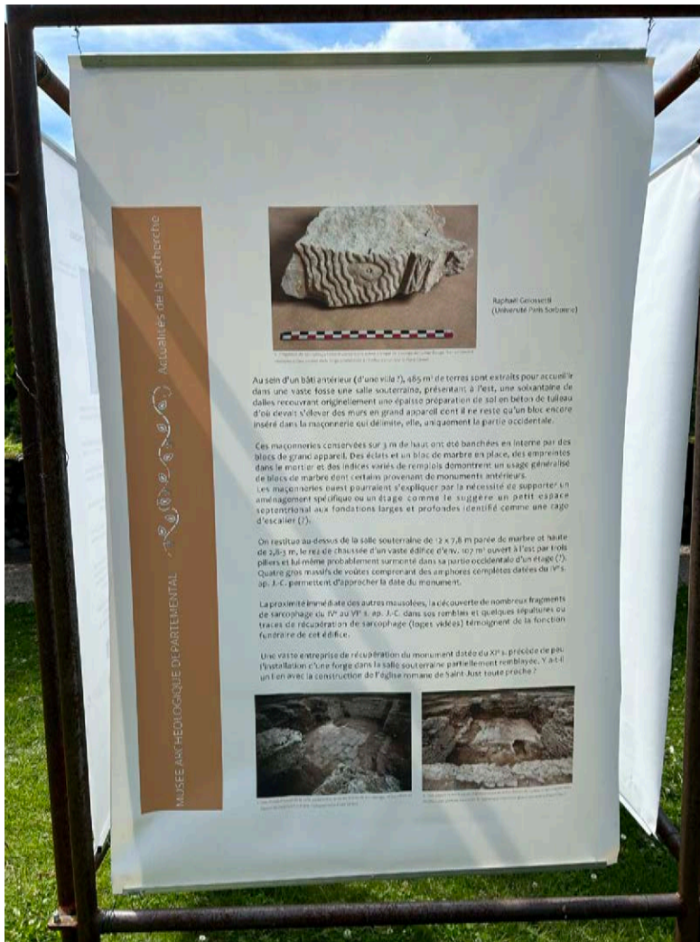
◀ Fig. 18 – Panneau d'exposition Actualités de la recherche du Musée archéologique départemental.