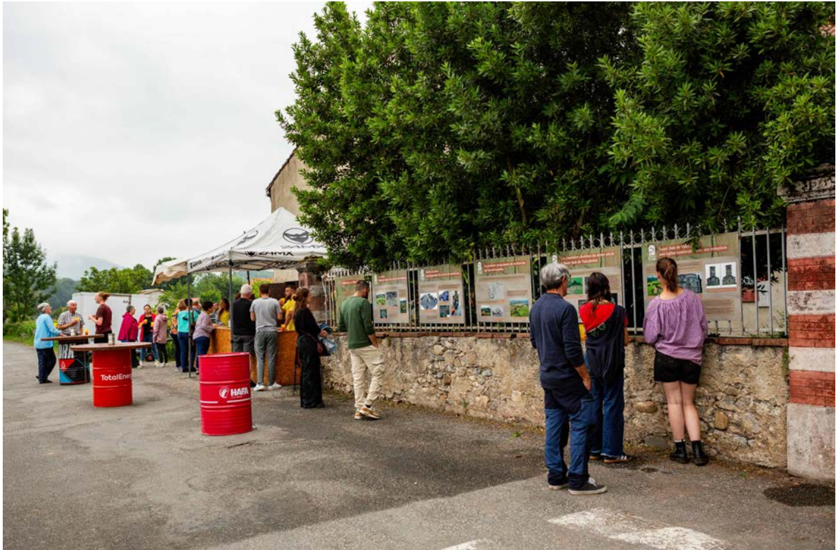
Fig. 1 – Vue d'ensemble de la nouvelle exposition de panneaux Archéologie au village , inaugurée à l'occasion du brandon.