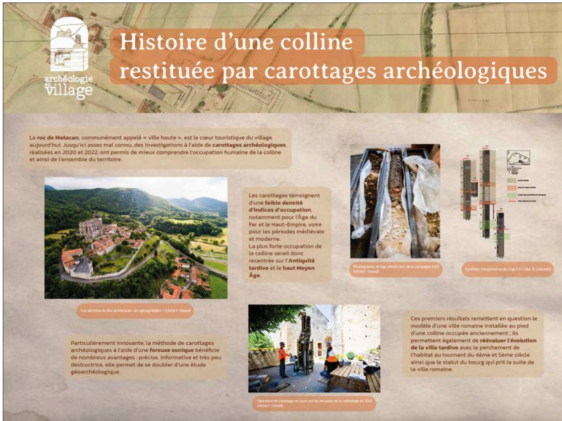
Fig. 26 – Exposition de panneaux Archéologie au village installée sur les grilles de l'école de Saint-Bertrand-de-Comminges (réalisation Julie Quéré).