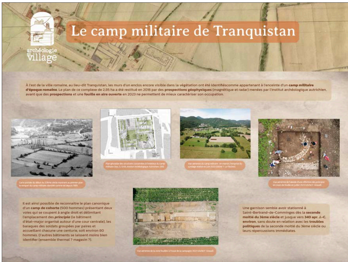
Fig. 27 – Exposition de panneaux Archéologie au village installée sur les grilles de l'école de Saint-Bertrand-de-Comminges (réalisation Julie Quéré).