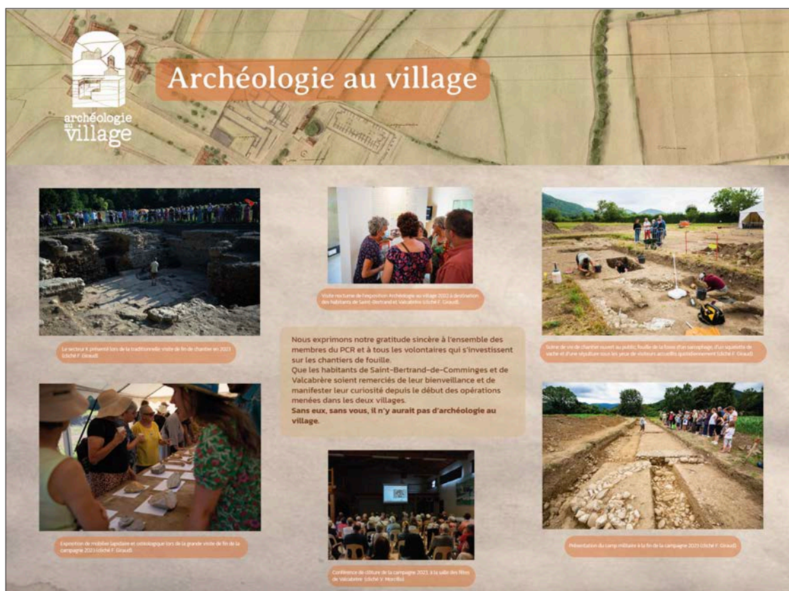
Fig. 31 – Exposition de panneaux Archéologie au village installée sur les grilles de l'école de Saint-Bertrand-de-Comminges (réalisation Julie Quéré).