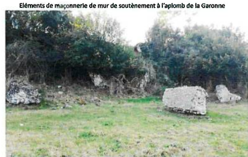
Vestiges présumés d'un ancien port romain en Bord de Garonne